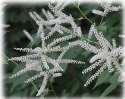
ヤマブキショウマ (バラ科)