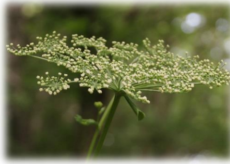
アマニューウ (セリ科)