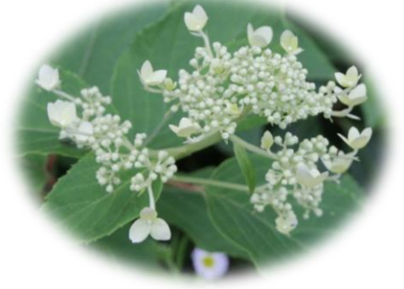
ノリウツギ (アジサイ科)