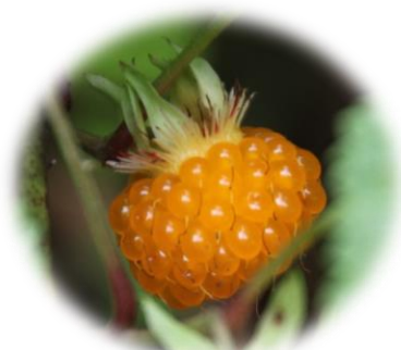
モミジイチゴ (バラ科) 木苺の中で最も美味しい。