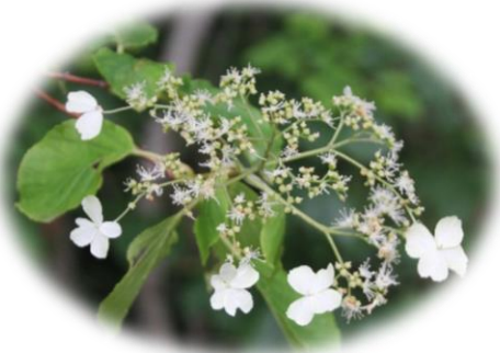
ツルアジサイ (アジサイ科)