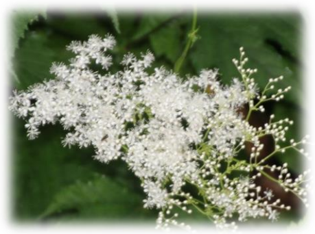
オニシモツケ (バラ科)