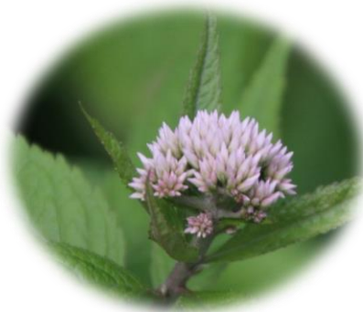
ヨツバヒヨドリ (キク科)