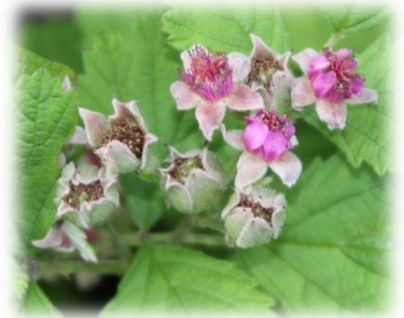
ナワシロイチゴ (バラ科)