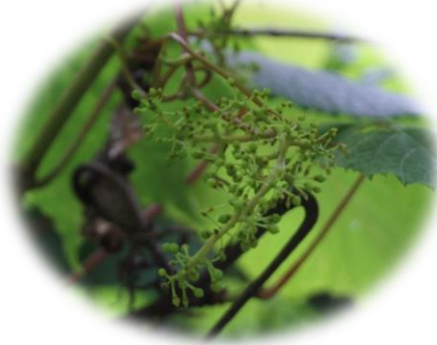
ヤマブドウ (ブドウ科)